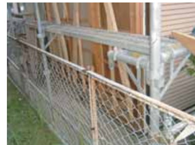
2. 外壁撤去、筋かい設置